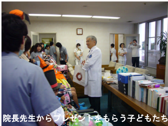
院長先生からプレゼントをもらう子どもたち

2時からは北里学級職員やボランティアの方、実習生も一緒に、病院内をパレードしました。子どもたちは、初めは恥ずかしそうでしたが、だんだんとテンションがUP。訪問先ではお菓子のプレゼントもあり、外来の患者さんたちからもたくさん声をかけていただきました。リハビリに来ていた年配の患者さんたちが笑顔で迎えてくれたことが印象的でした。